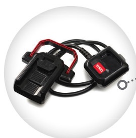
ATTACHE POWERLINK REVOLUTION 60 V MAX* 66005