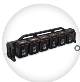
CHARGEUR À 6 EMPLACEMENTS FLEX-FORCE 60V MAX* 66560