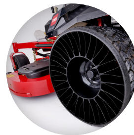
PNEUS POUR GAZON MICHELIN® X TWEEL 45,7 cm TWEEL 139-7890 (72504TE et 72542TE)