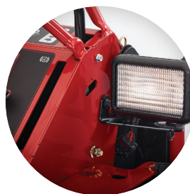
KIT D'ÉCLAIRAGE 114-3505 (74534TE, 74536TE, 74540TE) 133-1437 (72504TE, 72542TE)