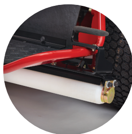
KIT TRAÇAGE DE BANDES 117-8560 (74534TE, 74536TE, 74540TE) 131-1436 (72504TE, 74542TE)