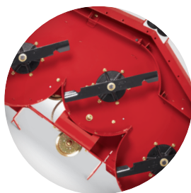
KIT RECYCLER® 110-2080 (74534TE) 134-3217* (74540TE) 139-6650* (72504TE) 134-3259* (72542TE)