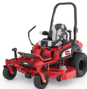
SÉRIE Z MASTER REVOLUTION®