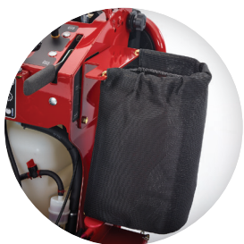
KIT SAC POUBELLE 121-7530 (74534TE, 74536TE, 74540TE) 133-1435 (74504TE, 74542TE)