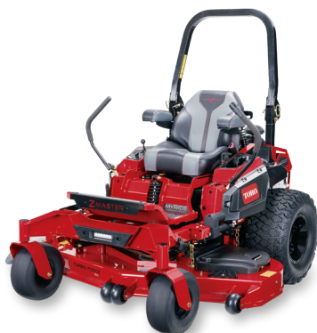
SÉRIE Z MASTER® 4000

COMPAREZ LES CARACTÉRISTIQUES PRINCIPALES POUR VOUS AIDER À TROUVER LES TONDEUSES LES MIEUX ADAPTÉES À VOS BESOINS.